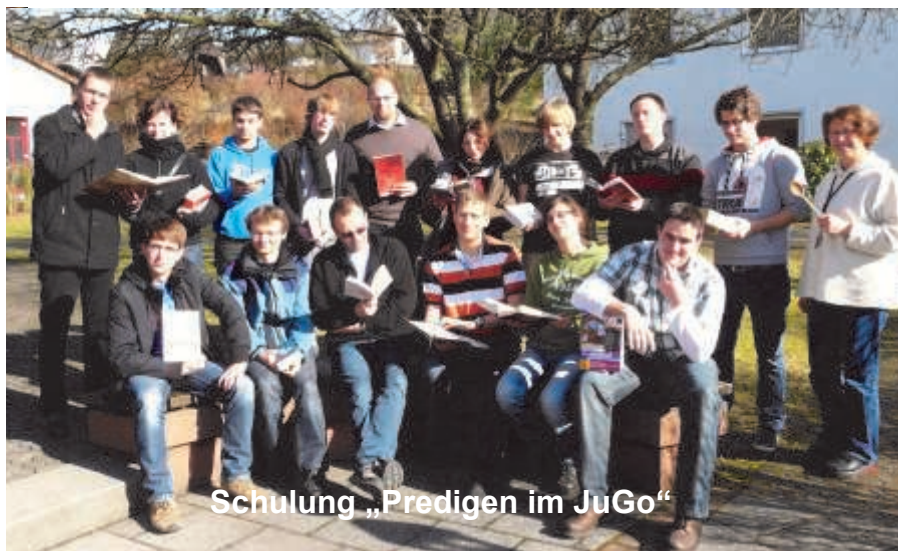
Schulung „Predigen im JuGo“