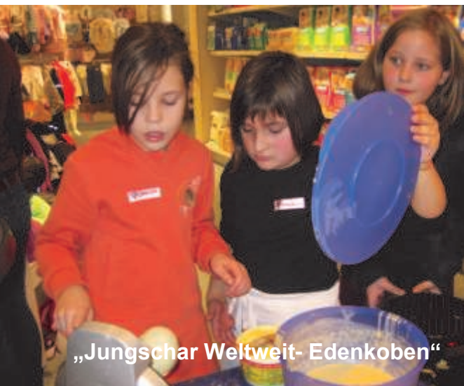
„Jungschar Weltweit- Edenkoben“